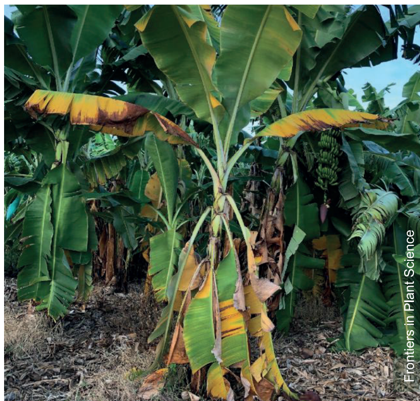
Las hojas inferiores mueren y quedan colgadas del pseudotallo