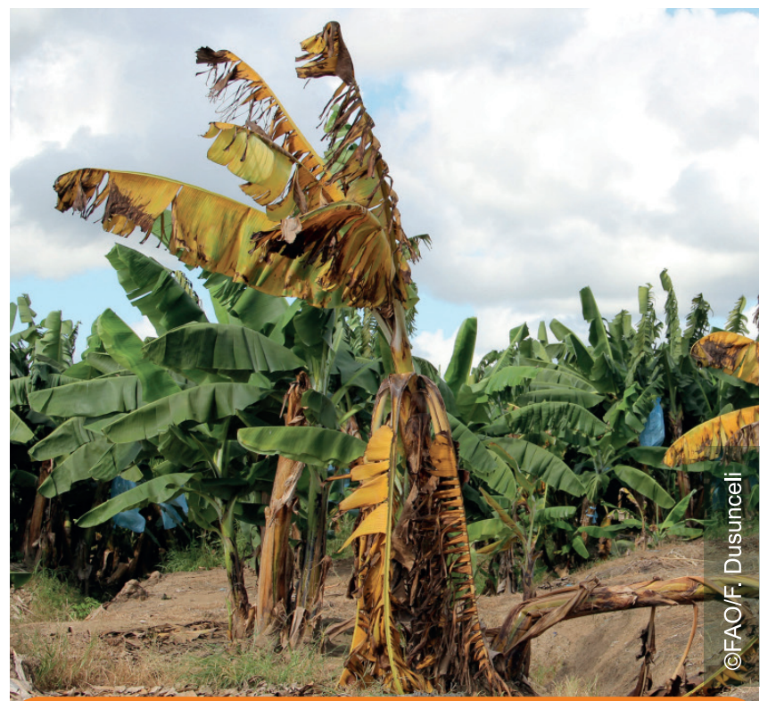
Finalmente la planta muere y permanece de pie