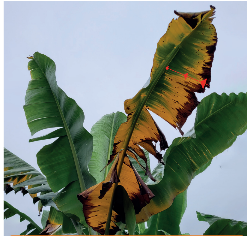
Amarillamiento uniforme en las hojas desde el margen foliar hacia la nervadura