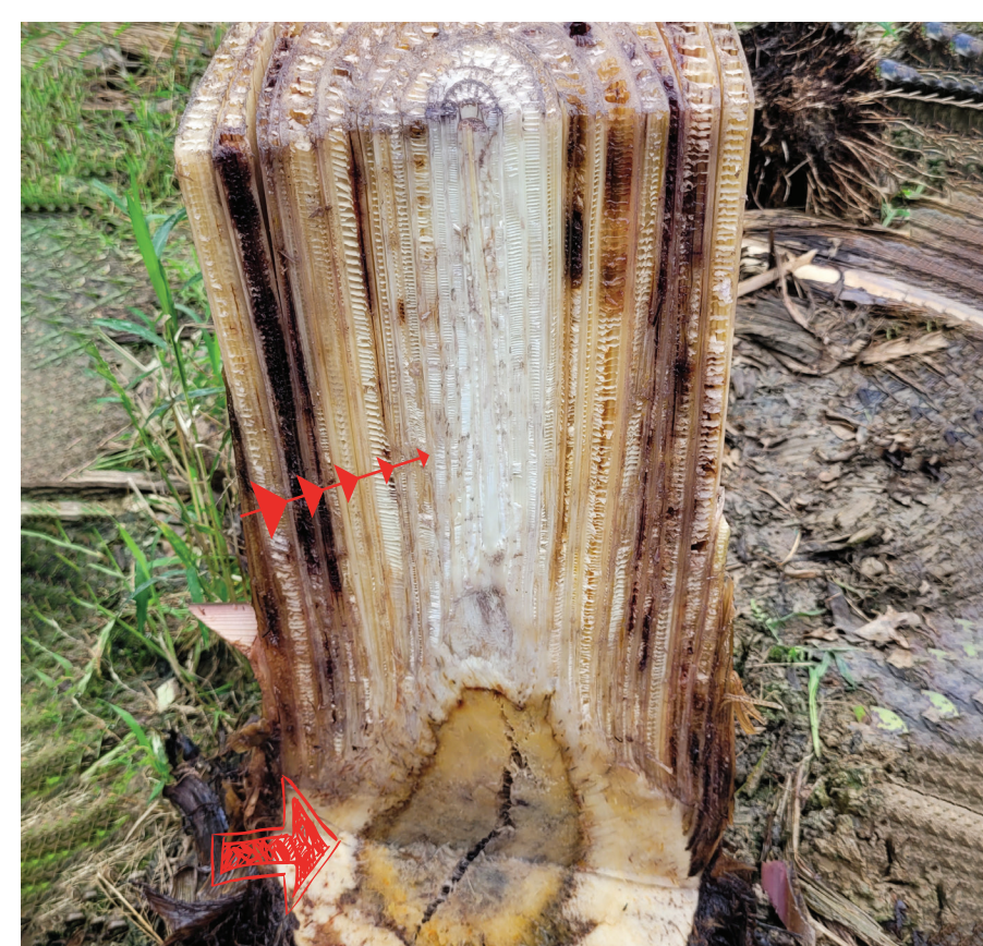
El pseudotallo y cormo se presentan con una coloración vascular café