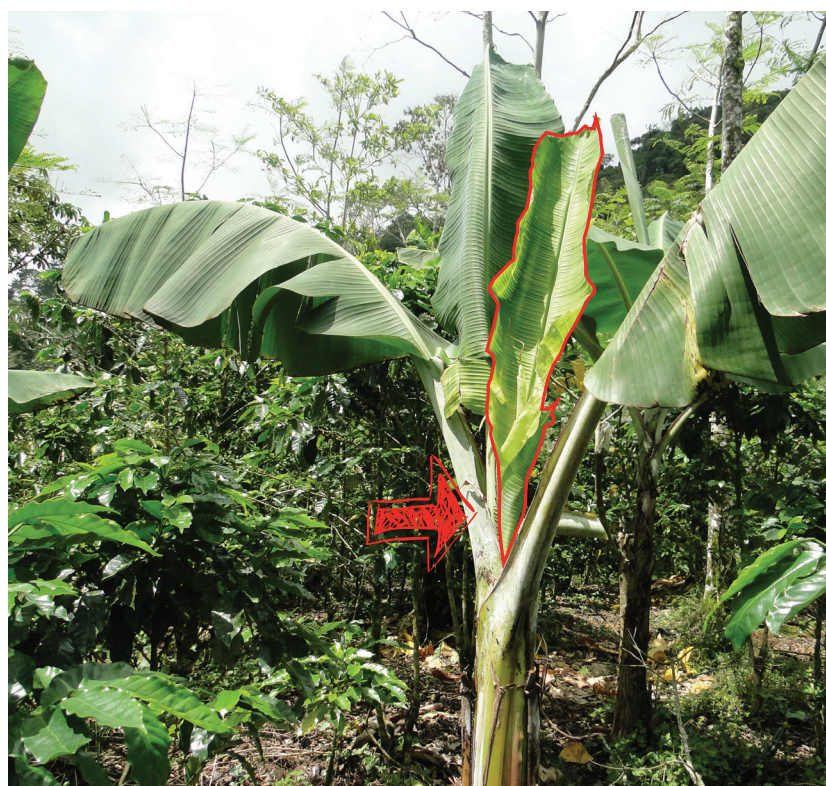
Acortamiento de la hoja bandera