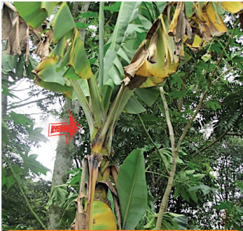
Acortamiento en los entrenudos