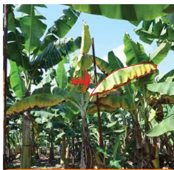
Amarillamiento uniforme en las hojas desde el margen foliar hacia la nervadura