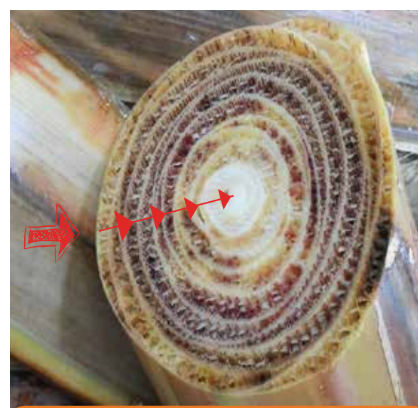
La afectación interna es de afuera hacia adentro