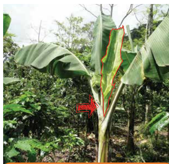
Acortamiento de la última hoja emitida - hoja bandera