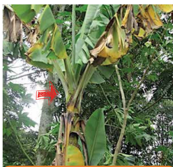
Acortamiento en los entrenudos