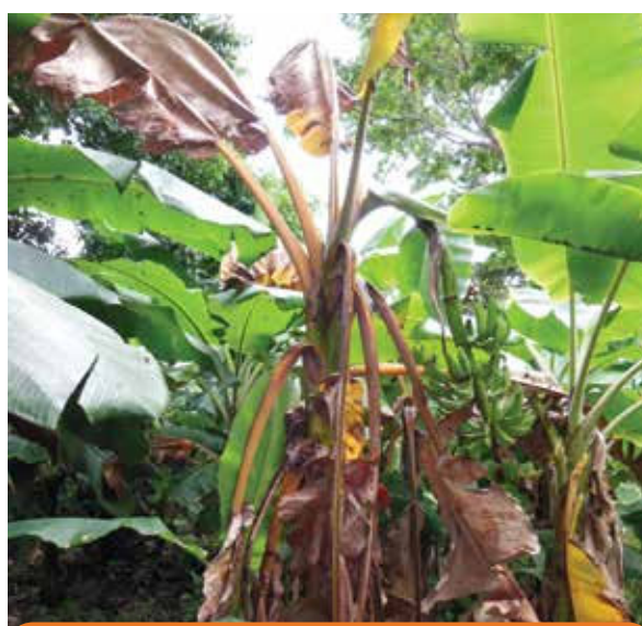
Marchitez de hojas nuevas y viejas. Las hojas inferiores mueren y quedan colgadas del pseudotallo