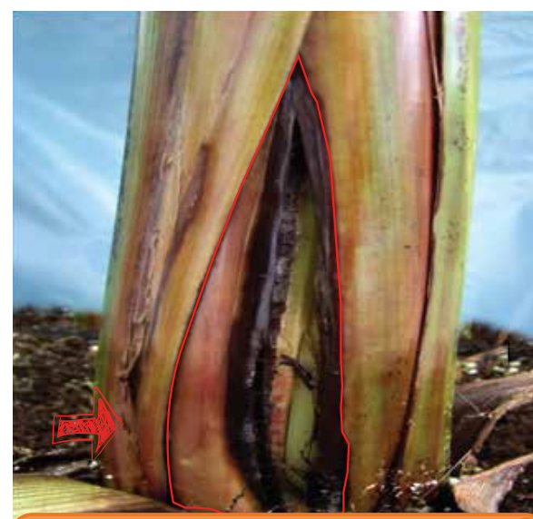
Abertura en la base del pseudotallo