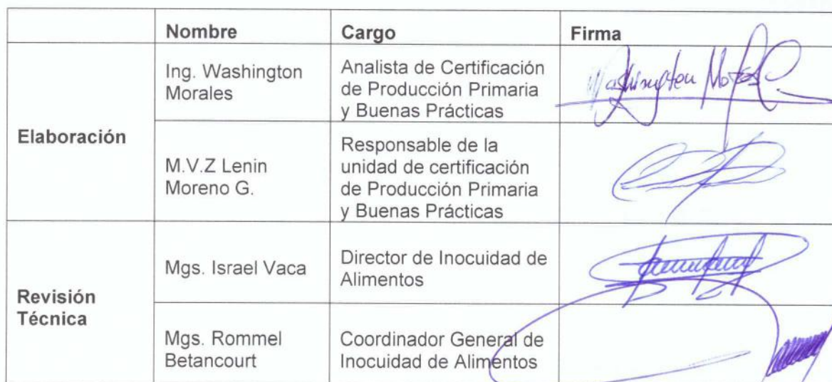
TABLA DE RESPONSABILIDADES