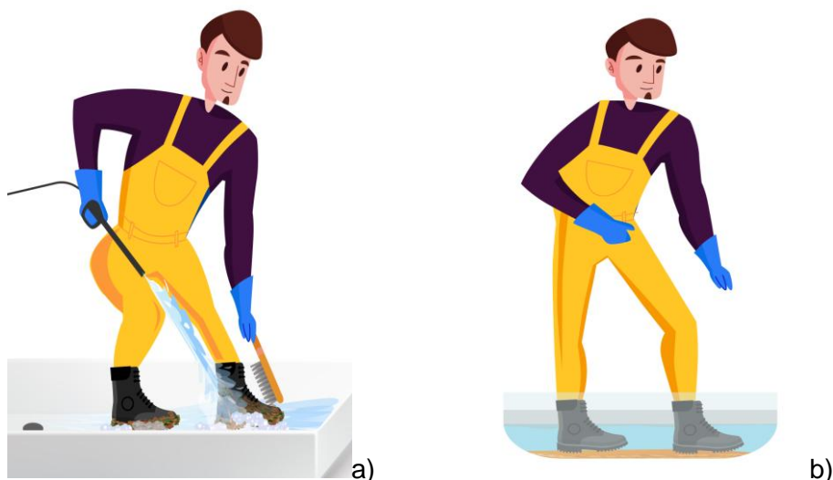
Figura 3. Proceso de limpieza y desinfección de calzado: a) Limpieza; b) desinfección (Agencia de Regulación y Control Fito y Zoosanitario, 2020)

Es importante enfatizar que el paso por las estaciones de limpieza y desinfección es obligatorio para todo el personal y visitantes que ingresen al lugar de producción.