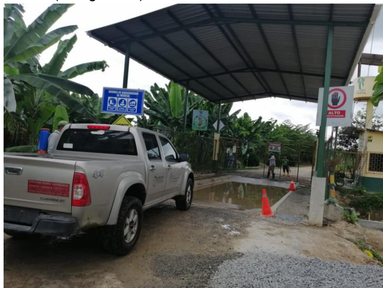
Fotografía 8. Rodiluvio al ingreso del lugar de producción (Agencia de Regulación y Control Fito y Zoosanitario, 2020).