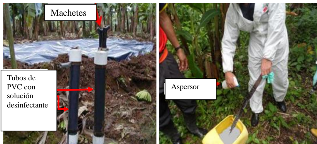
Fotografía 11. Desinfección de herramientas por inmersión en solución desinfectante (Agrocalidad, 2016).

Las estaciones de lavado y desinfección de herramientas, en especial las utilizadas para corte (machetes, podones) y aquellas que entran en contacto con el suelo (azadones, palas, barras) (Fotografía 11 y 12), pueden hacerse con materiales como tubería de PVC o con canecas donde se coloca la solución desinfectante o se puede utilizar atomizadores manuales; estas estaciones deben estar instaladas de forma estratégica, entre la zona de separación y la zona de cultivo.