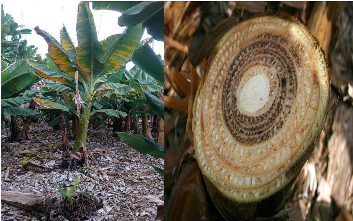
Fotografía 1. Síntomas externos de Foc R4T (Bubici, et al, 2019).

De acuerdo a Dita et al 2013 citado por Bermúdez, I. 2014, no existen diferencias en la sintomatología que ocasionan las diferentes razas de Foc en Musa.