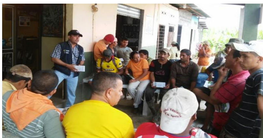
Fotografía 3. Capacitación sobre medidas fitosanitarias a trabajadores de lugares de producción (Agrocalidad, 2016).