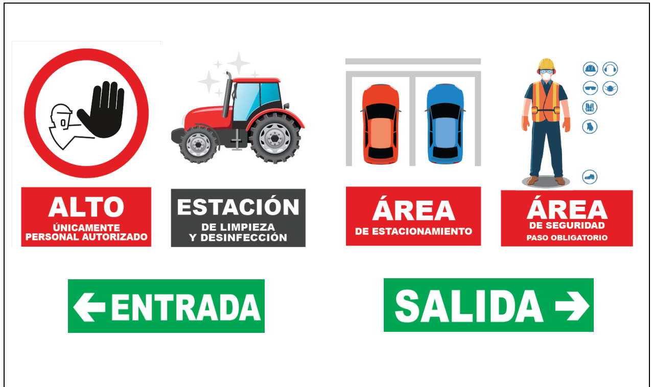
Figura 5. Ejemplos de señalética para el lugar de producción (Agencia de Regulación y Control Fito y Zoosanitario, 2020)