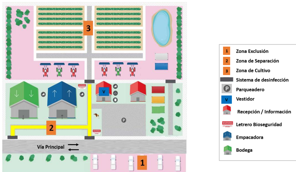
Figura 1. Esquema de zonificación de un lugar de producción

Es el área de producción de musáceas, donde los vehículos, maquinaria, herramientas y equipos operan y donde el personal realiza actividades agrícolas.