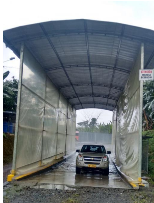
Fotografía 9: Arco de desinfección con rodiluvio para vehículos, previo a ingreso a un lugar de producción (Agrocalidad, 2016).