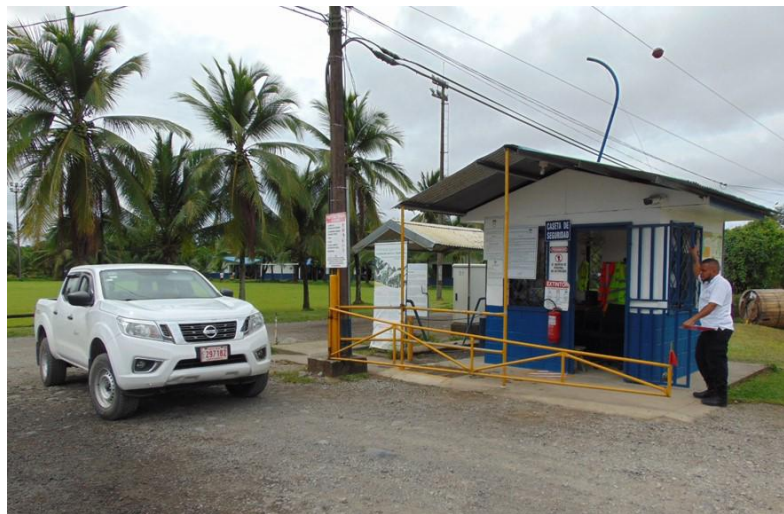
Fotografía 13. Garita para el control de ingreso y salida (Pérez-Sánchez, L. et al 2019)

En la entrada o entradas del lugar de producción es necesario ubicar una garita o su equivalente para el control de ingreso y salida del personal, visitantes y vehículos; esta estructura puede variar conforme a las posibilidades económicas del productor (Fotografía 13).