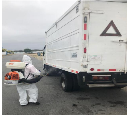
Fotografía 10. Desinfección de vehículos mediante bomba de aspersión a motor (Agencia de Regulación y Control Fito y Zoosanitario, 2019).