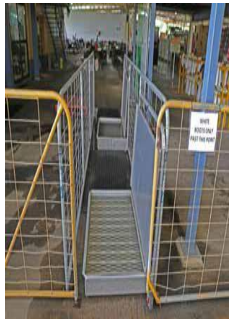
Fotografía 6: Pediluvio con desinfectante líquido para desinfección de calzado (Agrocalidad, 2016).