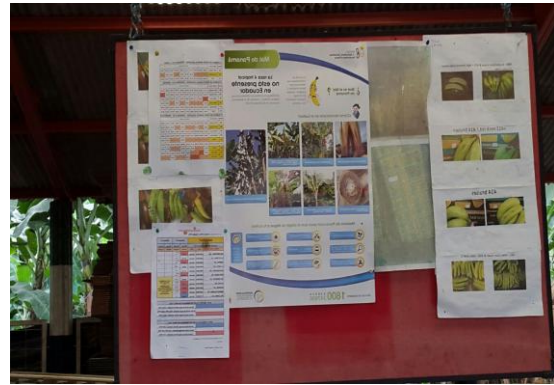
Fotografía 4. Medidas fitosanitarias.