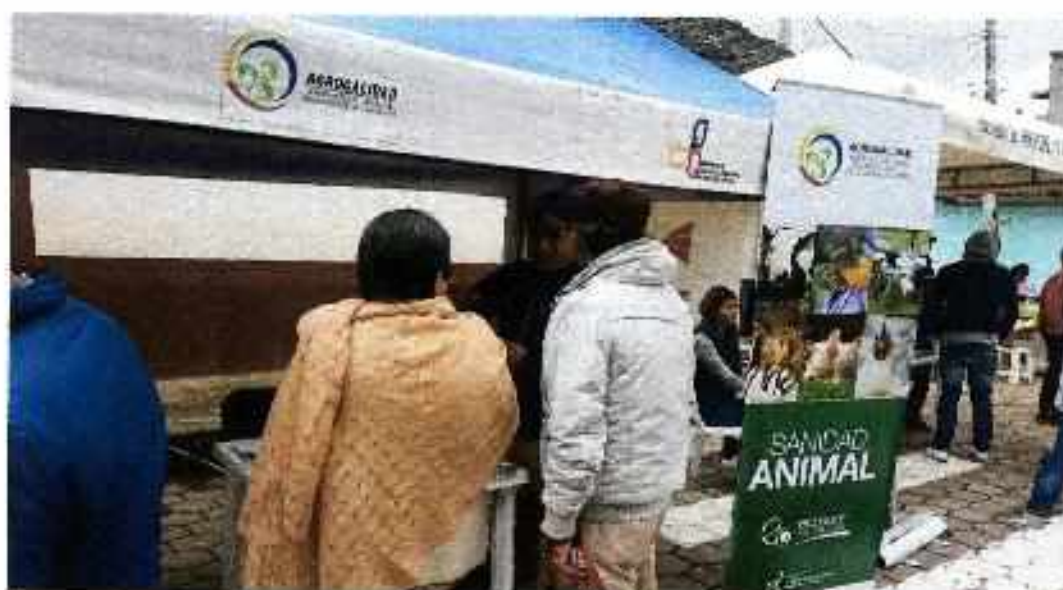
Visita a los stands por parte de las personas de la parroquia de San Isidro.