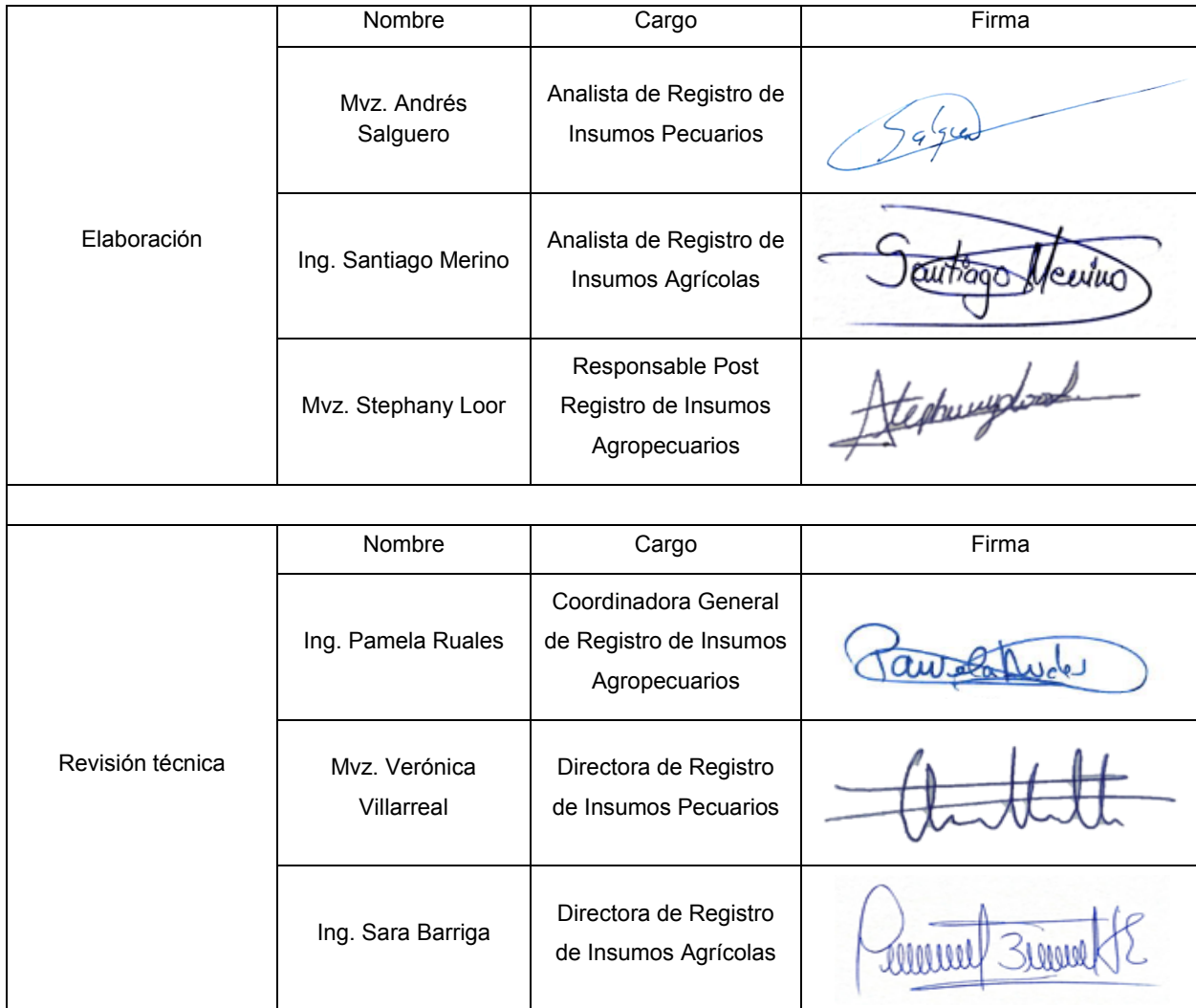
TABLA DE RESPONSABILIDADES